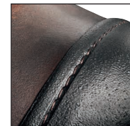
GÜK mit versenkten Nähten