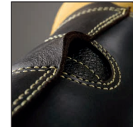
HAIX® FP System