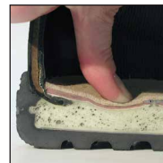
HAIX® MSL System